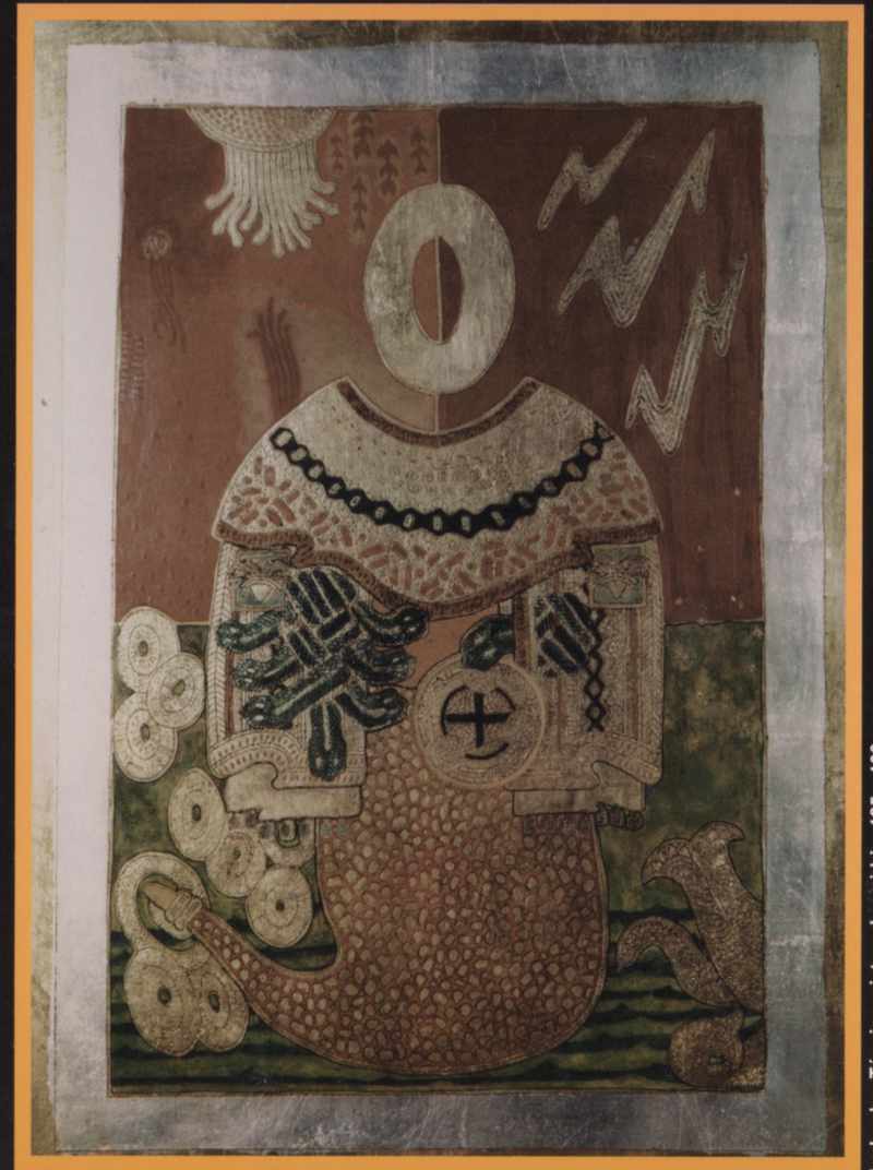
La Lucha: Técnica mixta sobre vitriño. 125 x 100 cms.