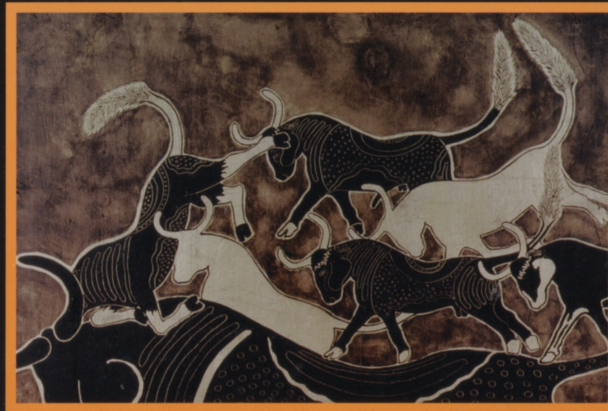
Mesura: Mixta sobre vidrio. 51 x 66 cms.

La obra de Claudia Hecht combina temas y formas precolombinas con materiales y conceptos contemporáneos de las Artes Plásticas: Desde visiones surrealistas de origen afroantillanos hasta composiciones geométricas a partir de animales fantásticos; todo ello con una limpieza técnica notable.